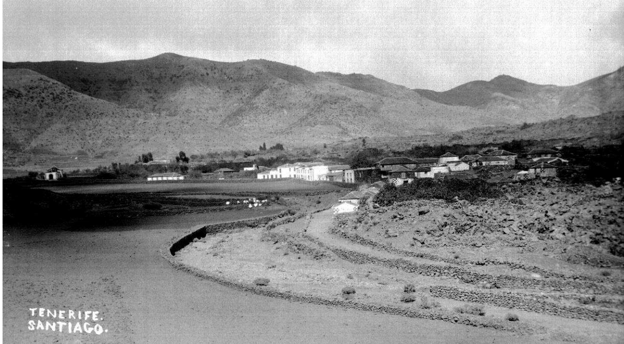
Nuestro biografiado se estableció en la Villa de Santiago, de la que fue alcalde mayor.