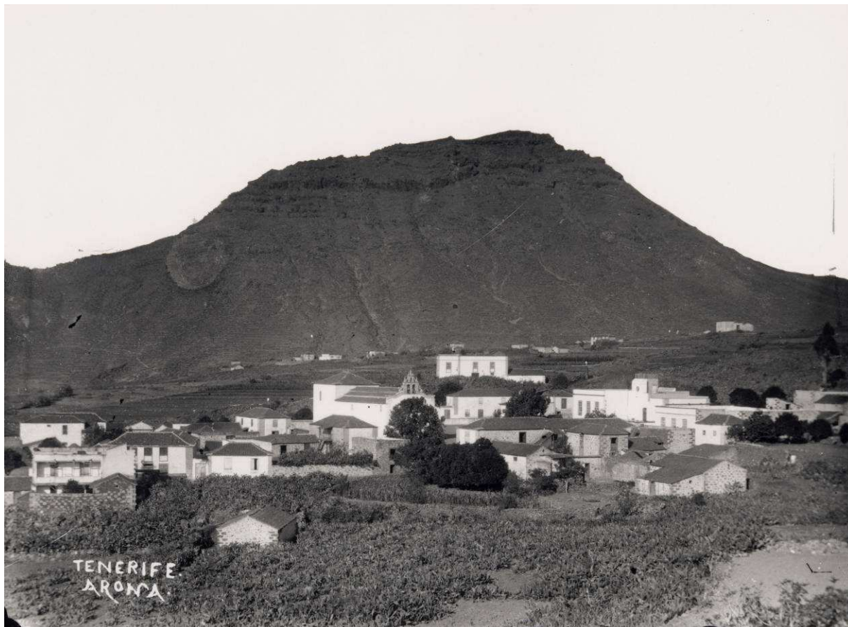
Durante la II República, Arona contó con una Federación Obrera y siete agrupaciones políticas.

El gobernador civil prometió al señor Tavío interesarse por el asunto que le encomendaba, para lo cual hará las gestiones del caso cerca de la Junta de Obras del Puerto. 35