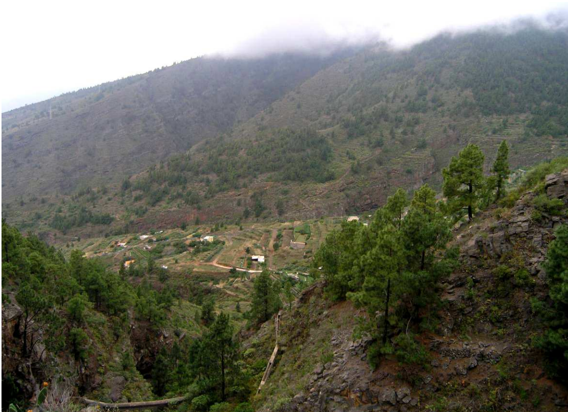
Los dos desertores se escondieron en el monte agreste de Igueste de Candelaria.

Desgraciadamente, no sabemos como concluyó este expediente, aunque suponemos que más tarde o más temprano ambos desertores serían detenidos y puestos a disposición de sus superiores en Santa Cruz de Tenerife, cumpliendo la condena que les correspondía por su polémica decisión, pues consta que por lo menos uno de ellos continuaba viviendo en Igueste algunos años después.