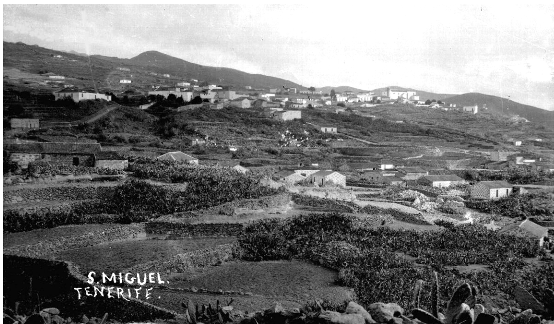
San Miguel de Abona vivió una intensa actividad política en la II República.