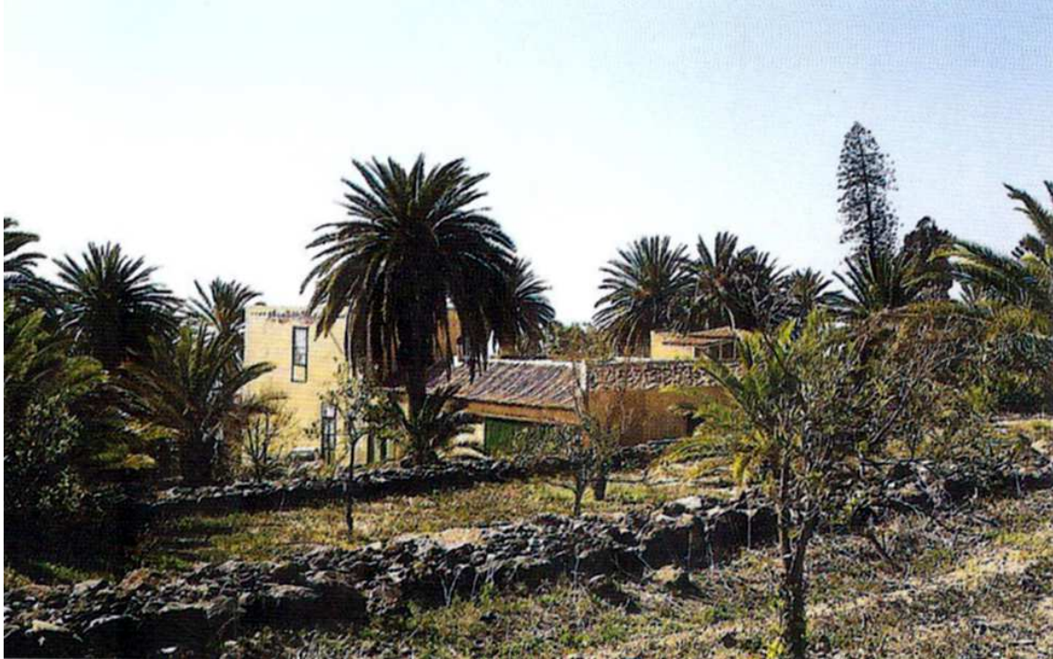
La hacienda de La Hoya Grande, con sus tierras, fue propiedad de la familia Afonso Montesdeoca.

debajo del Camino Real hasta la mar, que vale mil reales poco más o menos, cogiendo el veril del risco que va del camino haciéndolo lindero, y metiendo una pared por dentro, La Hoya Grande hasta el fumadero que es el lindero del asiento, así que la linda está probada con información de testigos hoy de noventa años, que es la linda de arriba, por encima de la era del balo que es por afuera del arrife que está en mi casa del Lomo del Clérigo, aquel llano delante de las colmenas, por allí arriba está el arrife y se hallará el ¿aljedro? aonde estaba el lindero y lo mandaron tumbar, y de la misma recta al fumadero del mar como dice la escritura censual [...]. 1