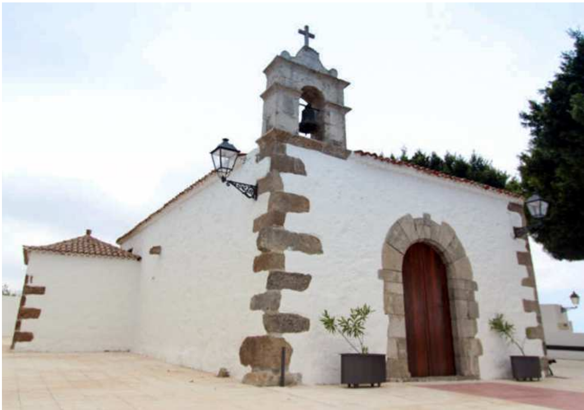
Los miembros de esta familia solían ser enterrados en la ermita de Ntra. Sra. de la Concepción de Tijoco, de la que eran patronos.