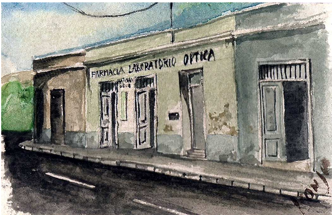
Antigua pintura de la Farmacia Batista de Güímar.