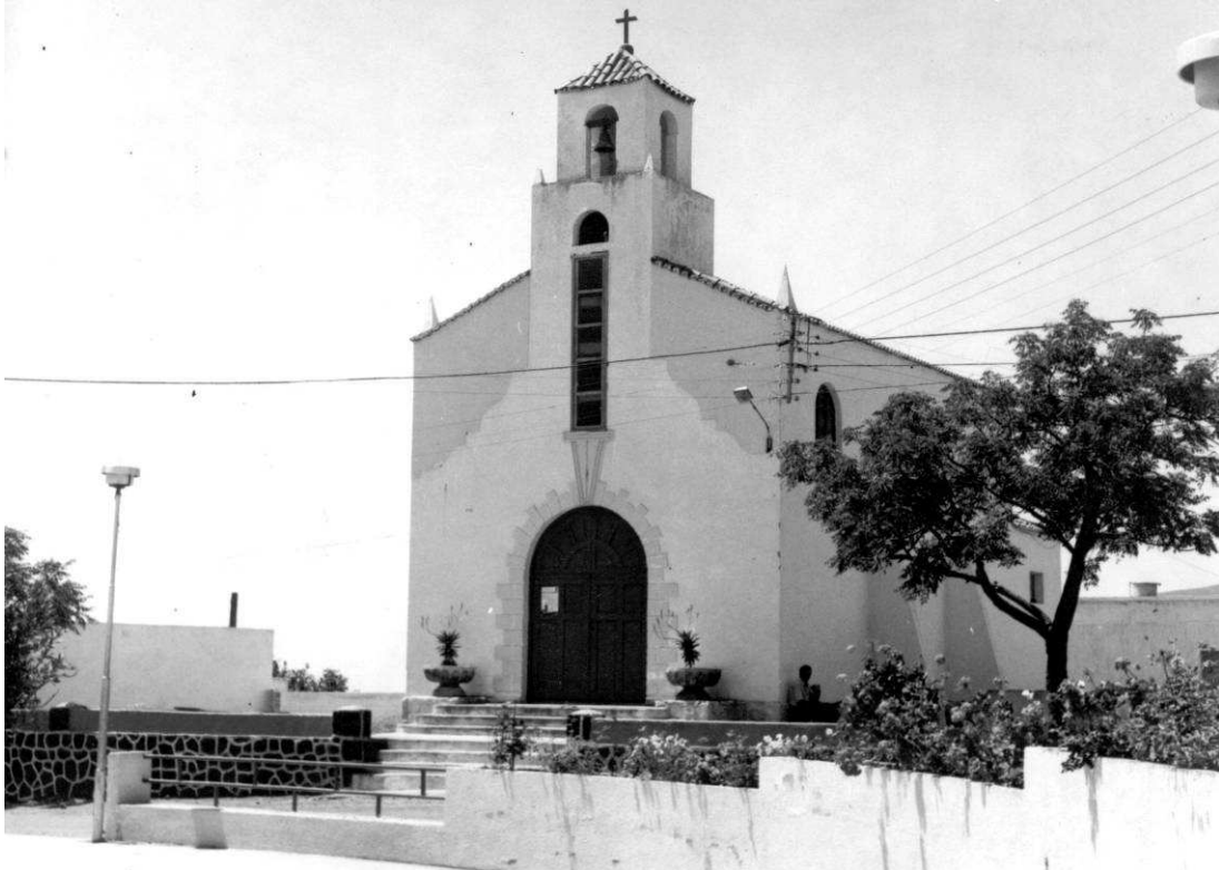
Tras su entrada en el municipio de Arafo, procedente de Güímar, la Virgen del Socorro ha visitado la ermita, hoy iglesia, de Ntra. Sra. del Carmen.

Causa principal, aunque no única, fue la coincidencia de la Misión con las fiestas patronales. 4