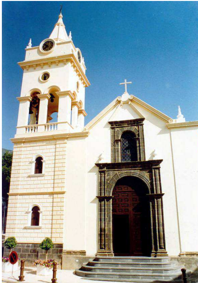
En cuatro ocasiones, la Virgen del Socorro ha visitado la iglesia parroquial de San Juan Degollado de Arafo.

Era la primera vez en la historia que la Virgen del Socorro visitaba el municipio de Arafo, en el que tanta veneración se le tenía. También fue la primera ocasión en la que visitó Fasnia, así como los distintos pueblos de la comarca güimarrera de Agache.