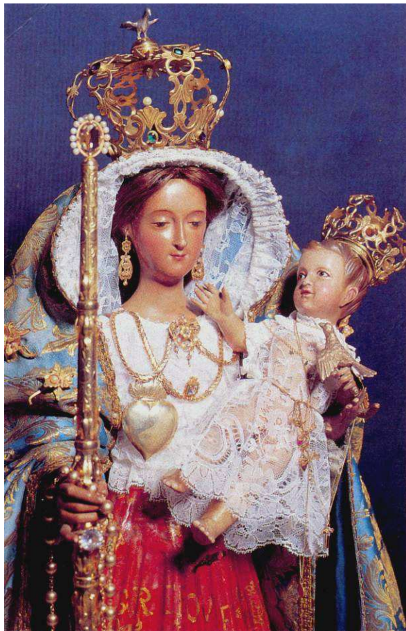
La Virgen del Socorro, profundamente venerada por los vecinos de Arafo.

Diversas han sido las visitas de imágenes de distintas advocaciones de la Virgen que, procedentes de otras localidades, por diferentes motivos se han acercado hasta la villa de Arafo. Algunas de ellas gozan en este municipio de una profunda veneración, sobre todo la Virgen del Socorro de la vecina ciudad de Güímar, imagen que ha visitado esta villa en cuatro ocasiones.