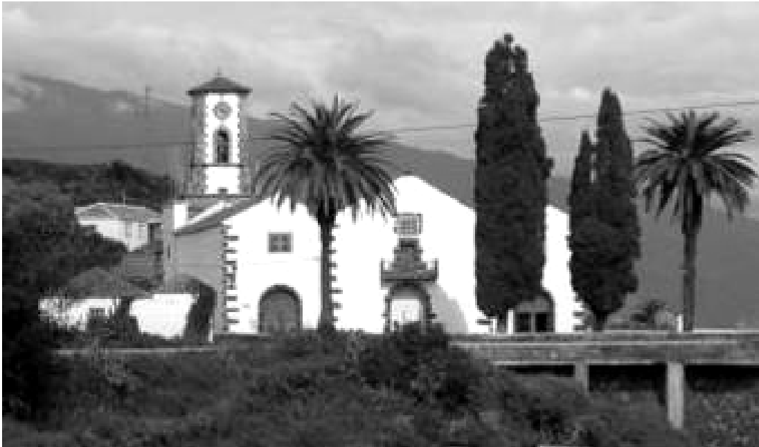
Su primer destino fue el de coadjutor de la parroquia de San Blas en Mazo.

Tras celebrar su primera misa en la parroquia natal de Tijarafe, el joven sacerdote fue destinado como coadjutor a la parroquia de San Blas en la Villa de Mazo, donde desempeñaba dicho cargo en 1878.