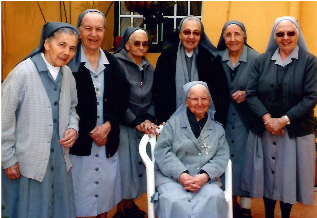
Al final de su vida, sentada, con algunas de sus compañeras de mayor edad del Colegio-residencia de Güímar de la Comunidad Religiosa de la Sagrada Familia de Nazaret. [Foto de Frasquita Coello].

A partir de entonces desarrolló una intensa misión religiosa y docente, impartiendo clases de Bachillerato, así como formación integrada a las clases más desfavorecidas, en distintos colegios de su Congregación, tanto de Canarias como de la Península: Colegio “Santo Domingo”, de Güímar; colegios “Montserrat”, “Nazaret”, “San José” y “Los Ángeles”, de Barcelona; Colegio “Sagrada Familia”, de Los Llanos de Aridane (La Palma); Colegio “Nazaret”, de Los Realejos; y Colegio “Nazaret”, de Madrid; en todos ellos fue inflexible ante la incultura. Abierta siempre a su formación, durante su estancia en Barcelona cursó dos años de Teología en el Colegio “Regina Mundi”.