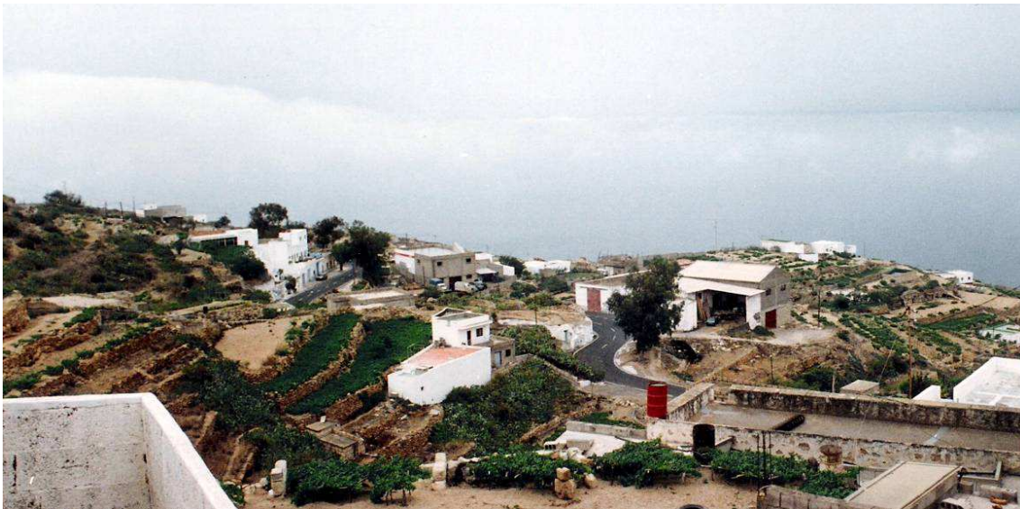
La familia Duque se asentó en Lomo de Mena y de ahí se irradió al resto del municipio.

Para su elaboración se han consultado archivos parroquiales, padrones municipales y prensa digitalizada. Pero dada la cantidad de miembros que abandonaron la comarca y se extendieron por otras localidades de la isla y de América, quedan muchas líneas abiertas para el futuro, que iremos completando a medida que nos lleguen nuevas aportaciones.