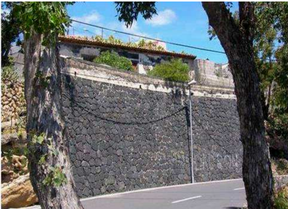
La caseta de los camineros de Lomo de Mena.