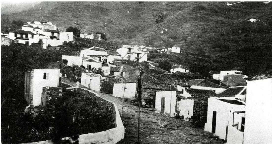
La Sociedad de Instrucción y Recreo “La Buena Unión” fue fundada en Igueste de Candelaria en 1931.

En este trabajo nos vamos a centrar en uno de los dos casinos que existieron en esa etapa en Igueste de Candelaria, por entonces el núcleo más poblado del término municipal. Se trata de la Sociedad de Instrucción y Recreo “La Buena Unión”, constituida en 1931, pero de la que de momento tenemos muy pocos datos, solo su reglamento y la elección de su primera junta directiva 2 . El otro casino, la Sociedad “Juventud Iguestera”, ya existía con anterioridad y se mantuvo en una primera etapa hasta el comienzo de la Guerra Civil, reorganizándose después de ésta; permaneció en funcionamiento durante muchos años y de ella nos ocuparemos en otra ocasión.