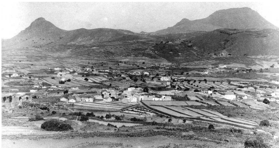
Doña Basilia nació en Valle de San Lorenzo (Arona), pueblo natal de su madre y en el que su padre ejercía como maestro.