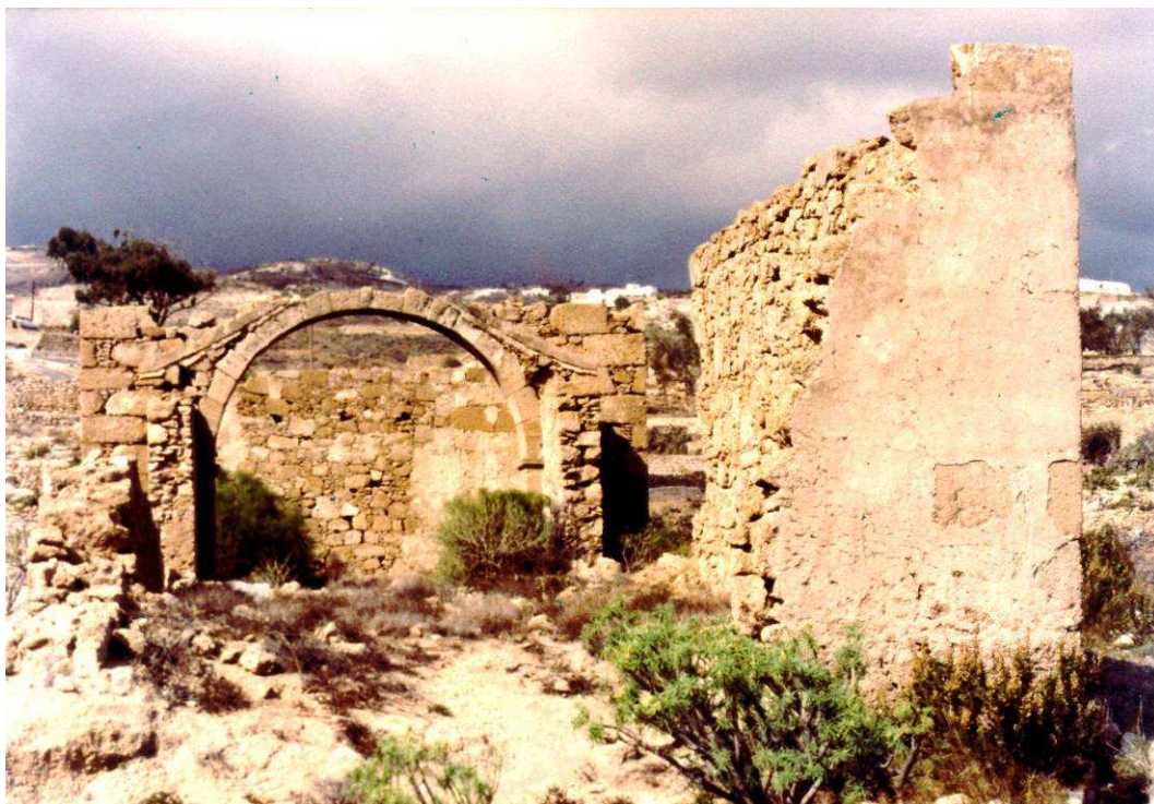
El único edificio público que existía en 1779 en el actual término de Fasnía era la "iglesia vieja" de San Joaquín.