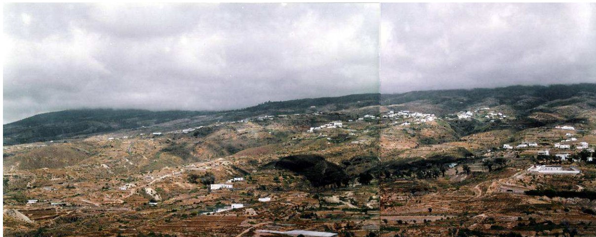
Los pagos de La Zarza, Sabina Alta y La Sombrera, desde la Montaña de Fasnía.