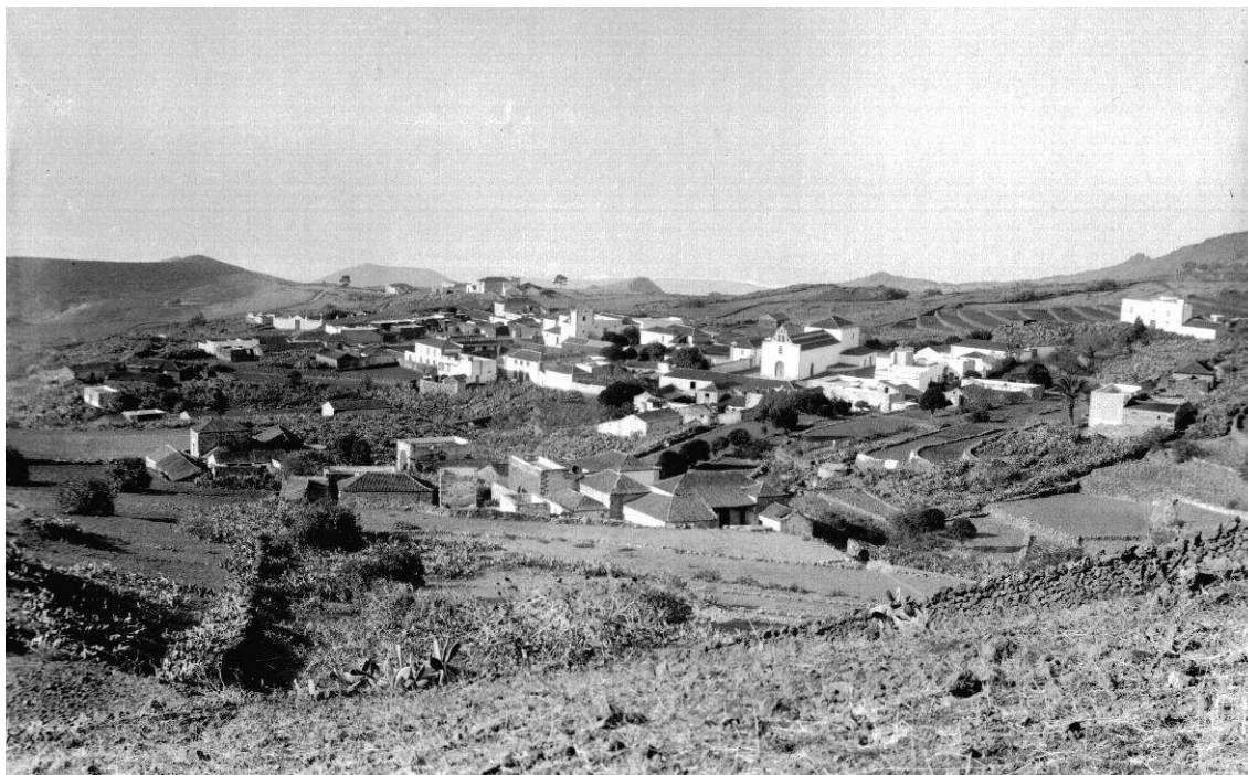
El Sr. Sarabia fue el primer alcalde real de Arona, tras su segregación de Vilaflor.

El 31 de marzo de 1788, nuestro biografiado continuaba como subteniente de la 6ª compañía, con 16 años, 9 meses y 11 días de servicio 13 . En igual situación seguía el 23 de febrero de 1790, habiendo servido siempre en el Regimiento de Abona 14 . El 1 de junio de 1791 figuraba como subteniente de Fusileros, con 19 años, 11 meses y 11 días de servicio 15 .