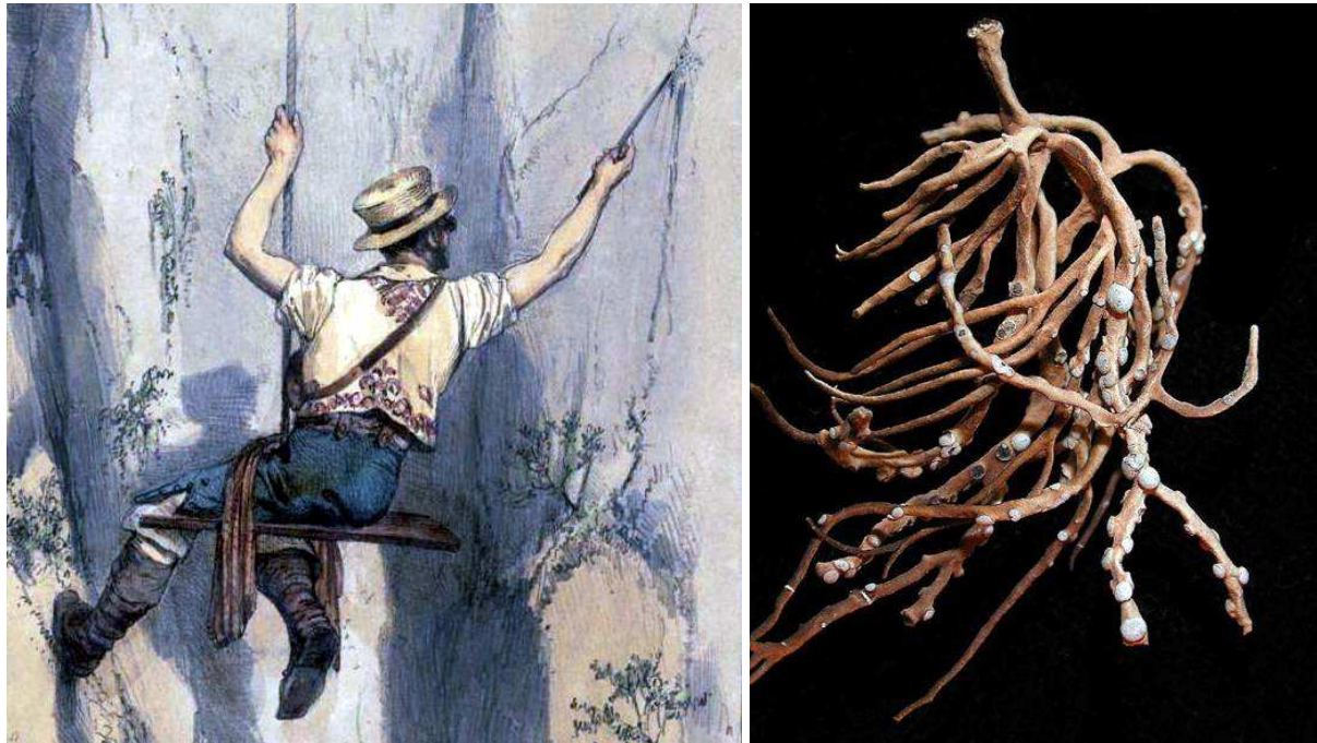
A la izquierda, un orchillero en pleno trabajo. A la derecha, imagen de la orchilla.

Como en otros lugares de la isla, en los acantilados que rodean Igueste los orchilleros buscaban el preciado líquen y, por lo menos, uno dejó su vida en este pueblo durante tan dura labor. El 19 de agosto de 1735, “fue sepultado en el cementerio de este lugar de Candelaria, un forastero que se derrisco en el Balle de Chacorche en Igueste. Recibió los Santos Sacramentos de Penitencia condicionalmente, y el de Santo Oleo; no hubo quien diera noticia de su nombre, apellido, ni demas, solo que era un orchillero de Icod el Alto” 1 .