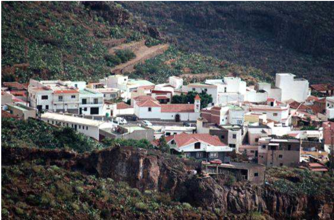
El profundo Barranco de Araca bordea por el sur al pueblo de Igueste.