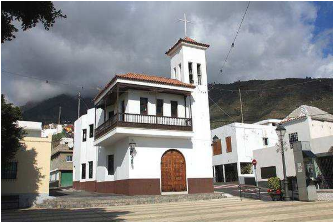
La Sociedad “El Porvenir de Araya” fue el único centro de recreo y cultura con el que contó en la posguerra el barrio de Araya de Candelaria.