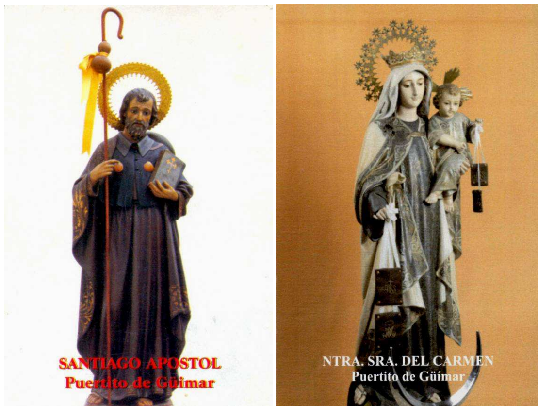
Imágenes de Santiago Apóstol y Ntra. Sra. del Carmen que se veneran en El Puertito.