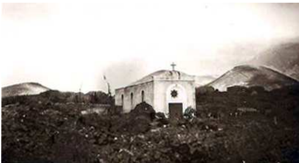
La ermita de Santiago Apóstol de El Puertito, recién construida en medio de las lavas del Malpaís y aún sin campana.