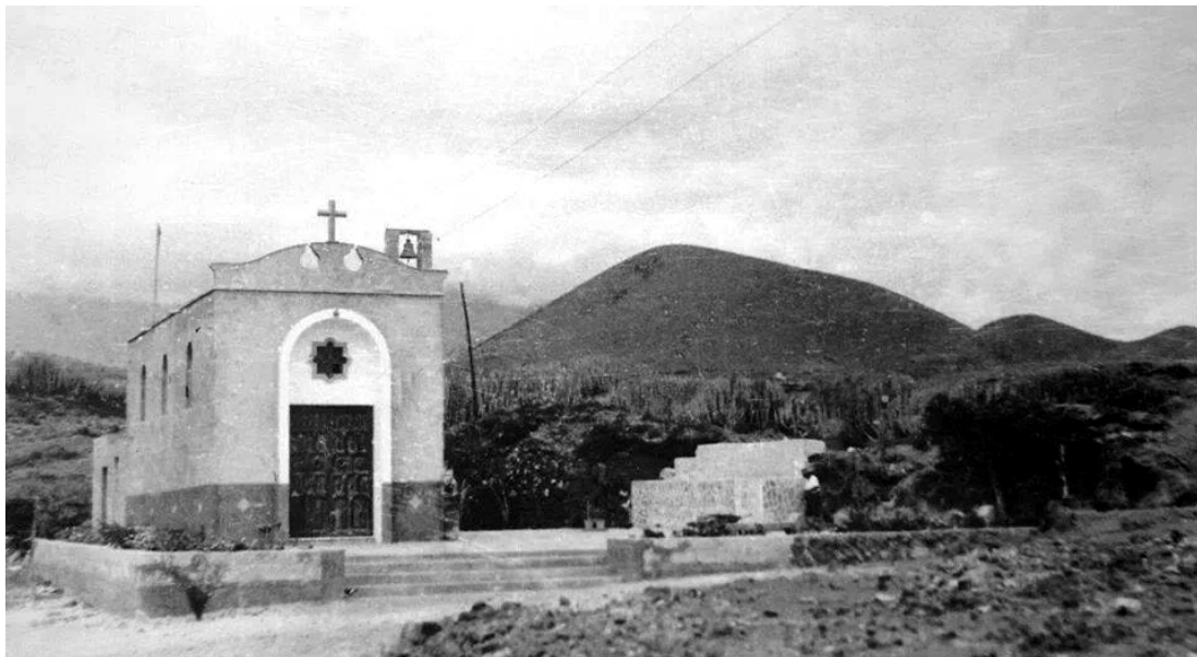
La ermita de Santiago Apóstol, ya dotada de campanario y una pequeña plazoleta, pero aún aislada.

Como curiosidad, en la Guía de la Diócesis de Tenerife , publicada en 1965 por el sacerdote don José Trujillo Cabrera, al hablar de los pagos y ermitas de la parroquia de Santo Domingo de Guzmán se incluía el: “Puertito, con 354 habitantes, a cinco kilómetros por carretera, con dos escuelas y ermita dedicada a Santiago Apóstol” 6 .