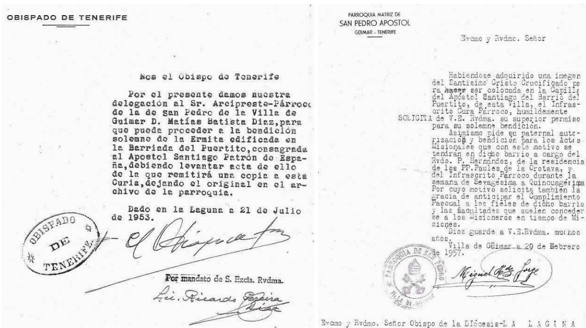
A la izquierda, delegación para la bendición de la ermita de Santiago Apóstol (1953). A la derecha, solicitud de licencia para la bendición de la imagen del Crucificado y Santa Misión (1957).