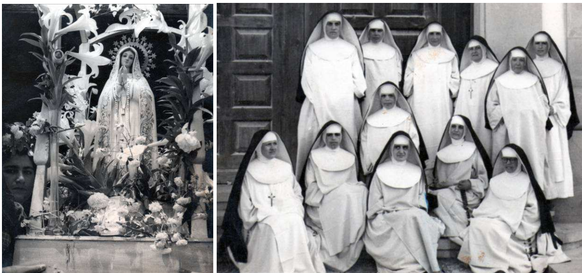
A la izquierda, la imagen de la Virgen de Fátima adquirida con su colaboración para la iglesia de Araya. A la derecha, con sus compañeras en la Basílica de Candelaria (2ª por la izquierda, sentada).