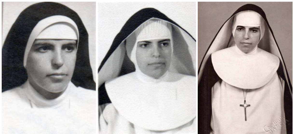
Tres aspectos de la religiosa arayera en su juventud.