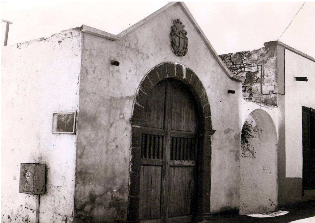
La Capilla de la Cruz en El Aserradero de Arafo.