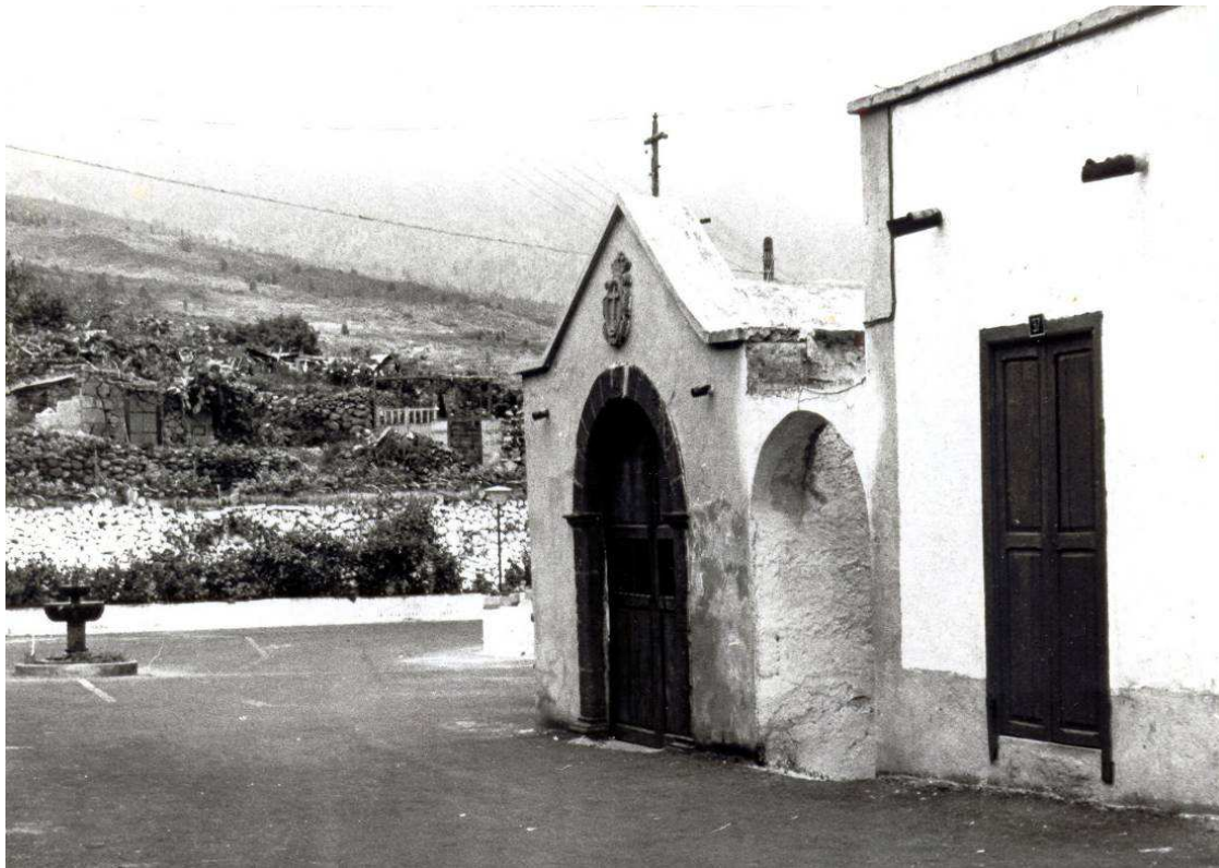
La Capilla tiene una puerta interior de comunicación con la casa de los propietarios. De la plazoleta anexa sale la popular Romería de San Agustín.