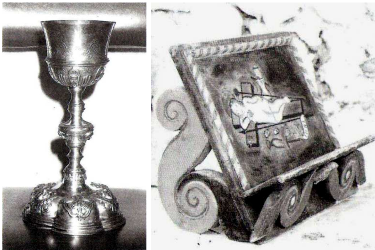
Cáliz y atril de la Capilla de la Cruz, éste decorado con pinturas. [Fotos de Frasquita Coello].

Calvario, lo cierto es que los descendientes de éste se encargan cada año de su enrame, labor encomendada a los más jóvenes de la familia.