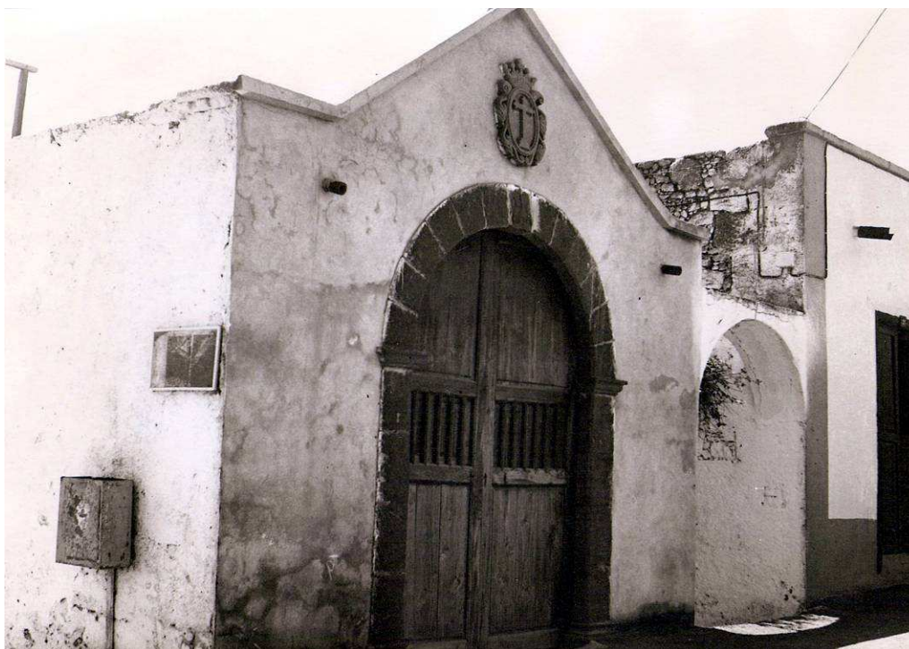
La Capilla de la Cruz en El Aserradero de Arafo.