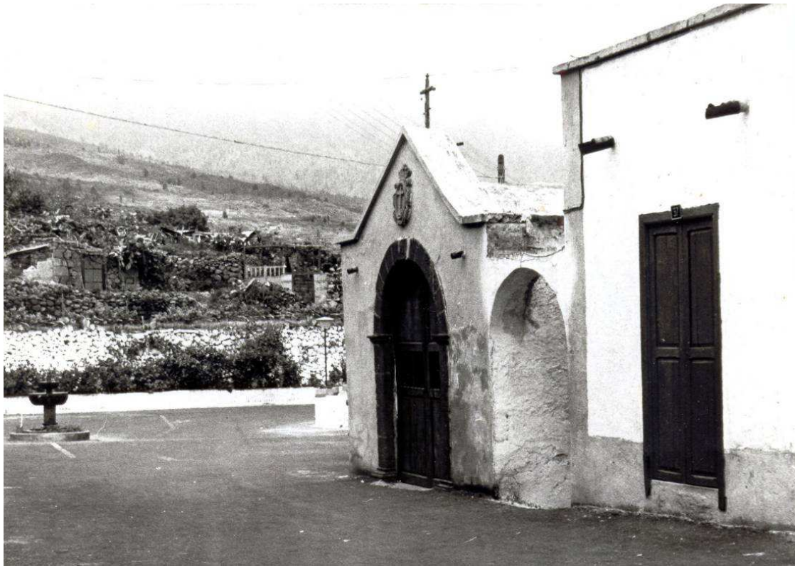
La Capilla tiene una puerta interior de comunicación con la casa de los propietarios. De la plazoleta anexa sale la popular Romería de San Agustín.