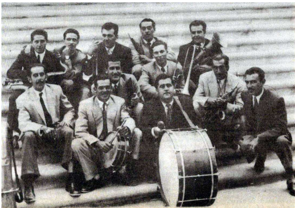
La Banda de Música “Apolo” de Adeje en 1937. [Fotografía reproducida en Diario de Avisos , 23 de junio de 1991].

El 17 de julio de ese mismo año 1936, la banda de música de Adeje participó en el “concurso de bandas” celebrado en Chimiche (Granadilla de Abona) con motivo de las fiestas en honor de Ntra. Sra. del Carmen, como informó Gaceta de Tenerife el 15 de dicho mes: “A las tres de la tarde, paseo en la Avenida de Primo de Rivera, y Concurso de bandas, en las que tomarán parte las de Adeje, Arafo, Granadilla, Charco del Pino y Los Blanquitos” y por la noche, “A las diez, como remate de fiesta, habrá en la plaza una gran verbena, amenizada por las antedichas bandas”. 21