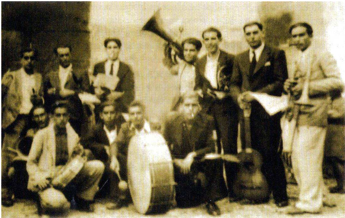
La Banda de Música de Adeje en 1939, en su traslado al Porís de Abona (Arico).

Una vez finalizada la Guerra Civil, la Banda de Música de Adeje actuó en las fiestas del Porís de Abona, según publicó El Día el 20 de septiembre de 1939, pues destacaba que: “Todos estos actos estarán amenizados por la banda de música de Adeje y la típica Danza del Escobonal”. 28