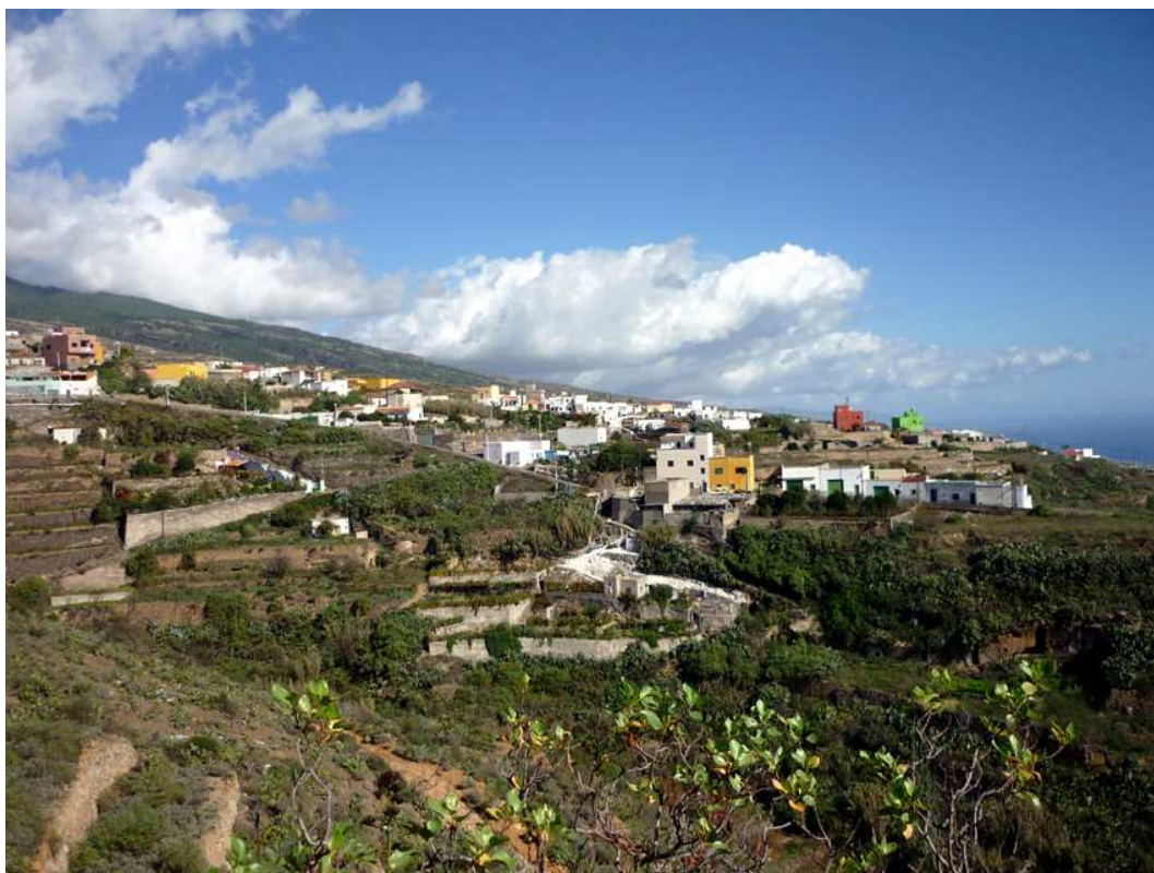
La Sociedad “Unión Cultural 1º de Mayo” fue el único casino que ha tenido La Zarza.

Como ya señalamos en un artículo anterior, durante la II República llegaron a coexistir en el municipio de Fasnía cinco casinos o sociedades de recreativas: la Sociedad Cultural “1º de Febrero” de Fasnía (1928-1936), que fue la más antigua y de mayor duración; la Sociedad “Unión Cultural 1º de Mayo” de La Zarza (1932-1936); las Sociedades “Unión Agrícola” (1932-1936) y “El Porvenir” (1934-1936) de Sabina Alta; y la Sociedad “Unión Club” de La Sombrera (1935-1936), la de trayectoria más corta. Pero la Guerra Civil acabó con la existencia de todas ellas, siguiendo, como en tantas otras cosas, un vacío cultural de varias décadas. En este artículo nos vamos a centrar en la corta trayectoria de la Sociedad “Unión Cultural 1º de Mayo” de La Zarza, el único casino de este pueblo en toda su historia.