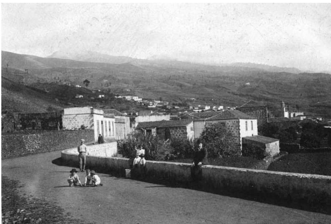
El maestro Bello estuvo al frente de la escuela elemental de Granadilla durante 12 años y medio.

En virtud de dicho nombramiento, tras 26 años al frente de la escuela de Charco del Pino, el 1 de marzo de 1905 don Cipriano pasó a la escuela elemental de niños de Granadilla (casco), logrando así un ascenso en su sueldo, que pasó a ser de 1.100 pesetas al año. Continuó regentando dicha escuela durante más de 12 años y medio, hasta alcanzar su jubilación.