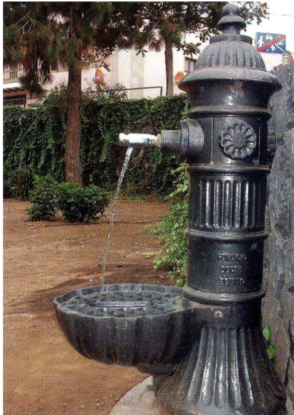
Uno de los grifos o fuentes públicas instalados en los barrios del municipio.

de agua, que permitió al gobernador llenar un vaso entre los aplausos del público; no se sabe lo que hubiese pasado si el gobernador mantiene abierta la llave durante mucho tiempo.