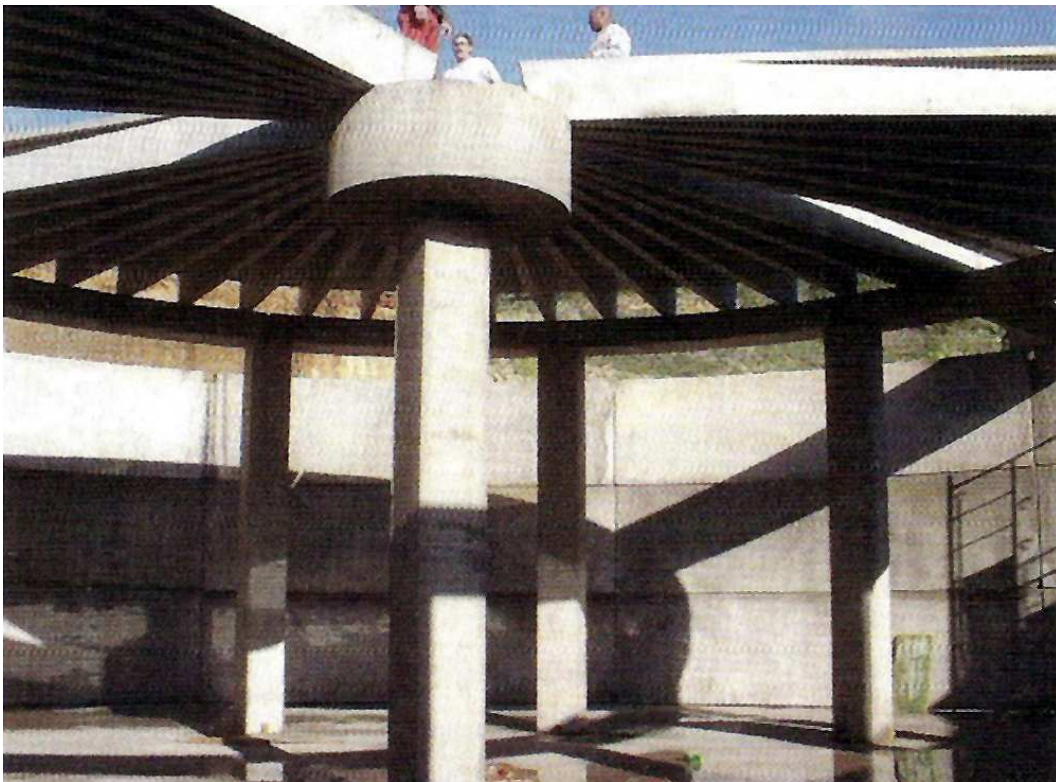
El actual depósito de cabecera de El Escobonal, cuando aún estaba en construcción en la parte alta de la Tambora de Arriba, en la zona conocida como Los Escobones.