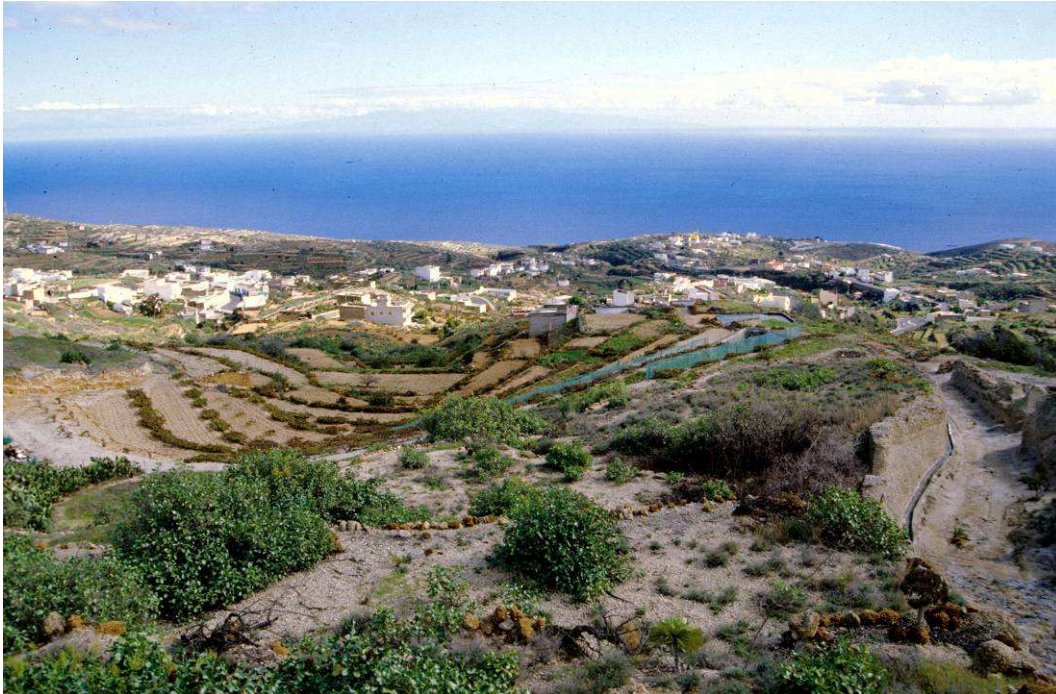
Vista panorámica de El Escobonal.

En 1932, el Ayuntamiento aprobó el proyecto de abastecimiento de agua potable a presión para el casco de Güímar, que fue inaugurado el 14 de abril de 1934, con motivo del tercer aniversario del advenimiento de la II República. Pero los pueblos de la comarca de Agache aún debían esperar tres décadas para contar con el servicio básico que ya disfrutaba el resto del municipio.