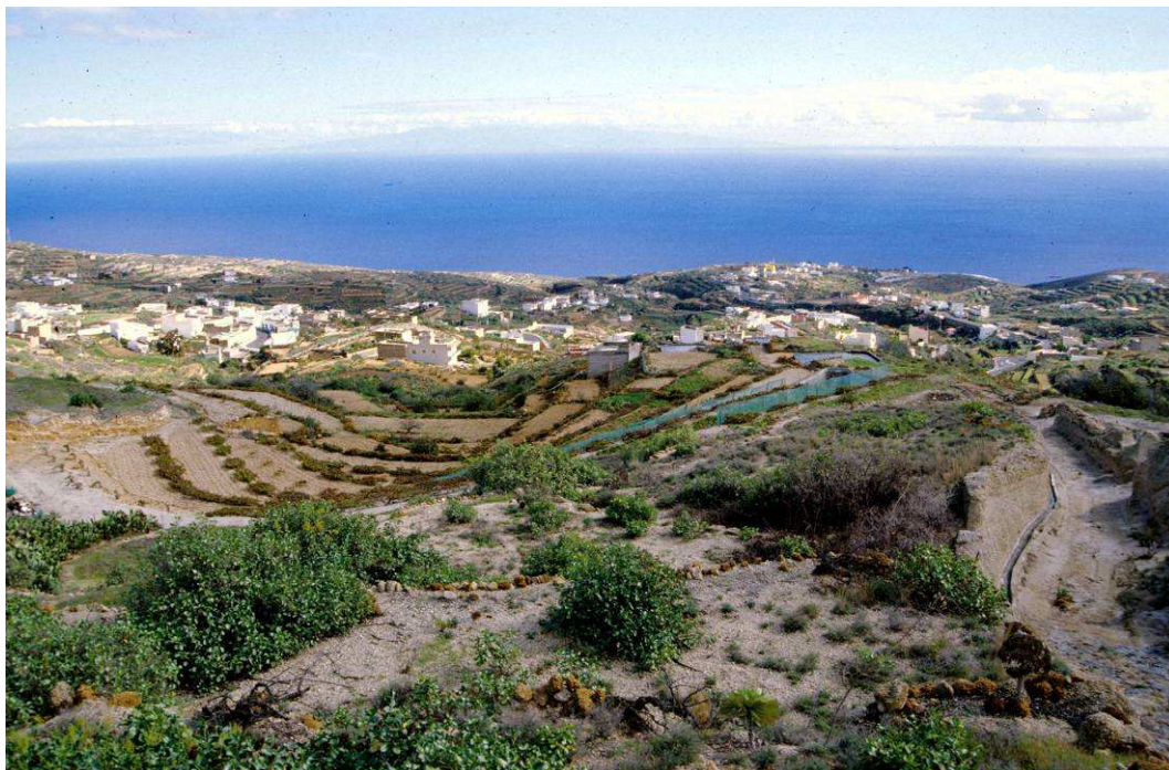
Vista panorámica de El Escobonal.

En 1932, el Ayuntamiento aprobó el proyecto de abastecimiento de agua potable a presión para el casco de Güímar, que fue inaugurado el 14 de abril de 1934, con motivo del tercer aniversario del advenimiento de la II República. Pero los pueblos de la comarca de Agache aún debían esperar tres décadas para contar con el servicio básico que ya disfrutaba el resto del municipio.