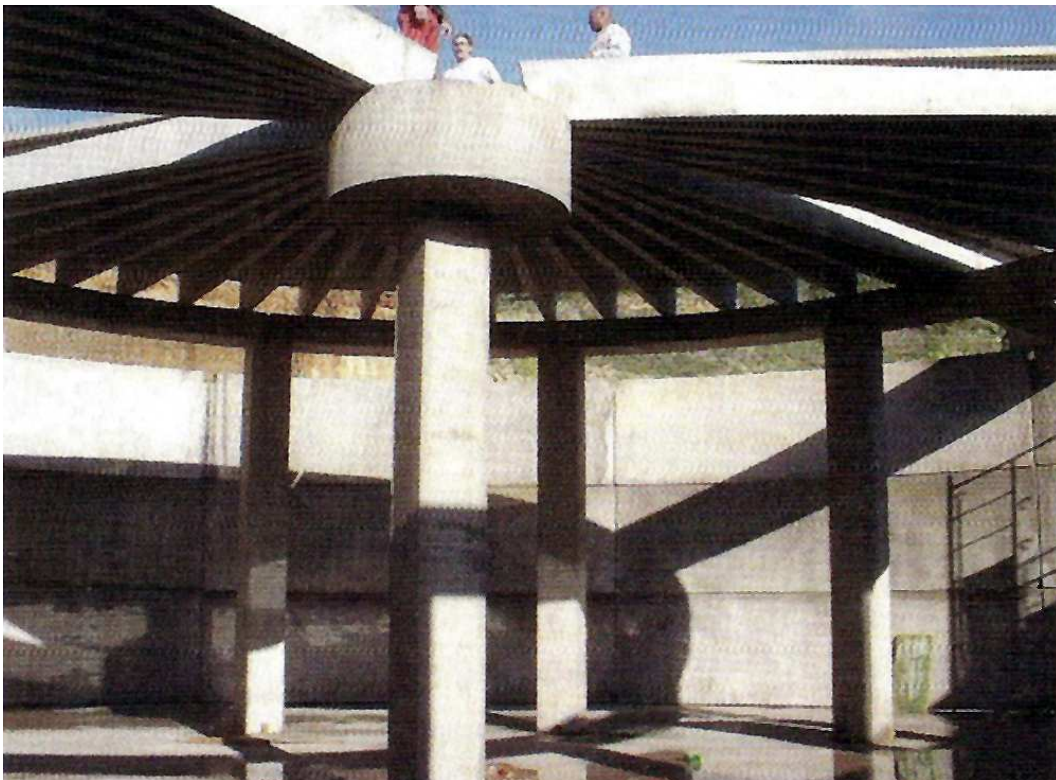
El actual depósito de cabecera de El Escobonal, cuando aún estaba en construcción en la parte alta de la Tambora de Arriba, en la zona conocida como Los Escobones.