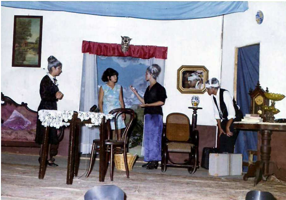
Interpretación de “ La Tercera Palabra ”, en 1969.

Pero en este trabajo vamos a centrarnos en uno de los grupos de aficionados que mantuvo una trayectoria más dilatada y exitosa, el Grupo de Teatro “La Juventud”.