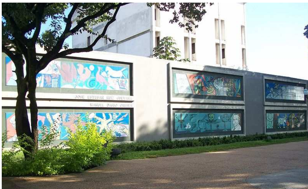
Plaza de los Poetas, en la ciudad de Barinas (Venezuela).

Asimismo, en Barinas intervino en diversas actividades culturales. Esta ciudad del occidente venezolano, capital del estado homónimo, se sitúa a orillas del río Santo Domingo y en el piedemonte andino, a unos 165 km de la ciudad de Mérida y 525 km de Caracas.