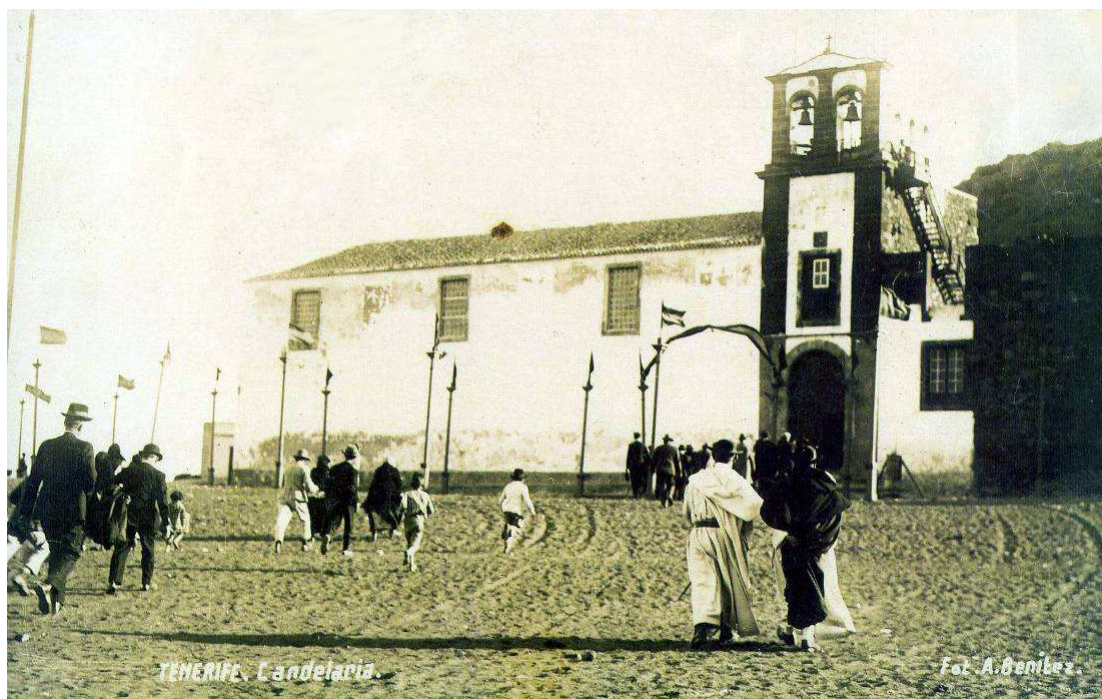
El Convento Real de Candelaria tras su reconstrucción en 1803, después de la destrucción del anterior en el incendio de 1789.