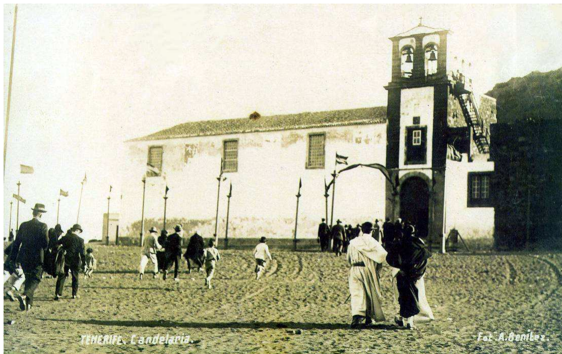
El Convento Real de Candelaria tras su reconstrucción en 1803, después de la destrucción del anterior en el incendio de 1789.