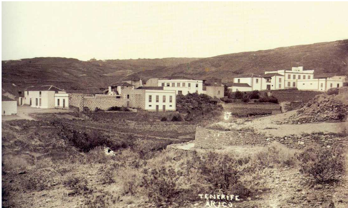
Arico el Nuevo, pueblo en el que se estableció don Bartolomé tras su matrimonio y donde vivió hasta su muerte.

Una nota posterior aclaraba la situación económica de nuestro personaje: “ Esta casa tiene una buena conveniencia de Bienes raíces, viña y más árboles; 5 animales grandes de servicio, 50 cabras, 50 ovejas; puede sembrar 15 fanegas de pan ”. Como se puede observar, la posición era bastante desahogada, figurando entre los vecinos más acomodados de toda la jurisdicción.