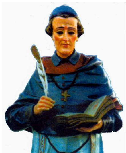
Un grupo de vecinos ante la antigua ermita de El Tablado y la imagen titular de San Carlos Borromeo.