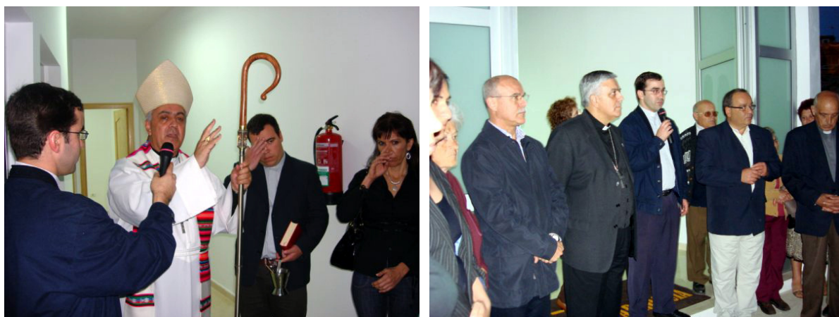
Bendición del edificio parroquial de El Tablado, en 2008.

Ahora sólo falta reunir el resto del dinero necesario y concluir cuanto antes las obras de la iglesia parroquial.