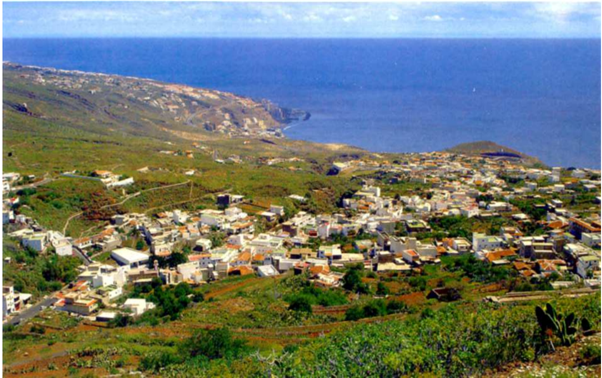
Vista panorámica del pueblo de Barranco Hondo, con la Media Montaña al fondo.