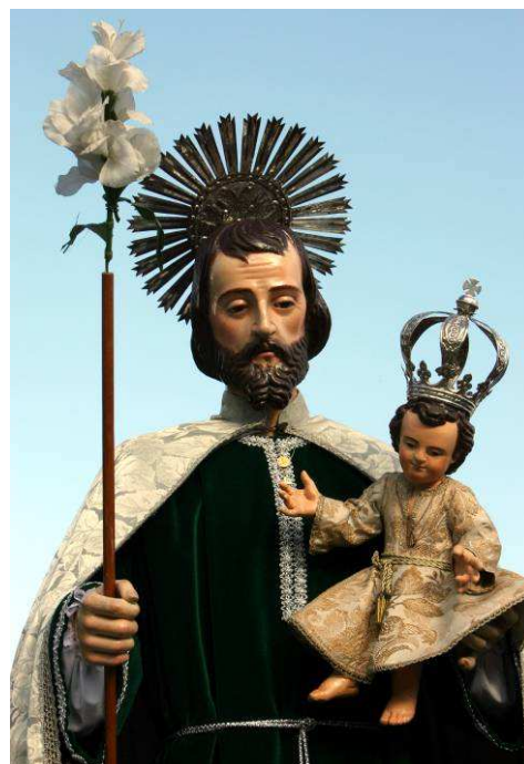
La imagen titular de la parroquia.