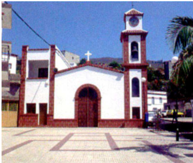
Iglesia parroquial de San José.