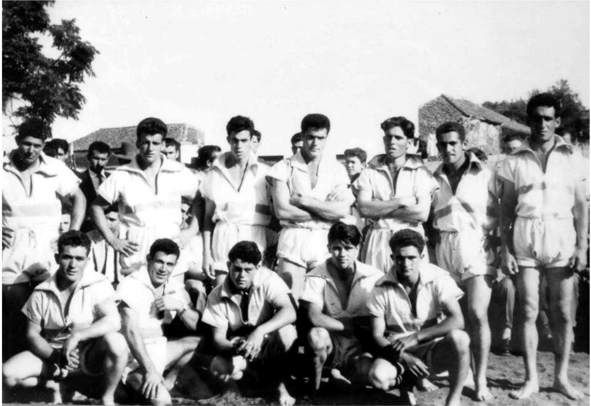
El club de luchas "Tinerfe", en 1959.