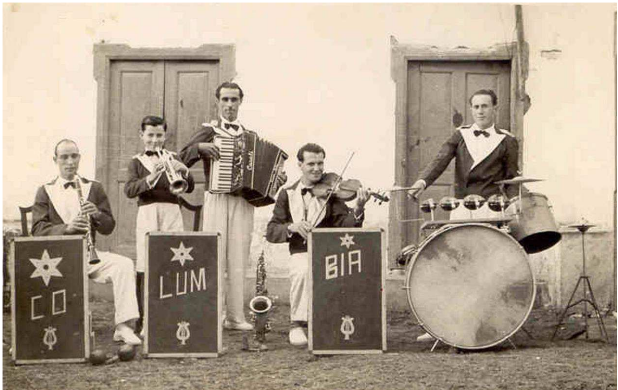
La célebre orquesta "Columbia".