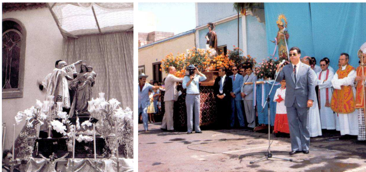
A la izquierda, coronación de la Virgen María Auxiliadora en 1957. Y a la derecha, acto de nombramiento de la Virgen como Alcaldesa Honoraria y Perpetua de Arafo en 1982.